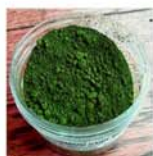
OSSIDO DI CROMO VERDE FOGLIA 70/V