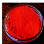
ROSSO VIVO 170/O

Pigmenti in polvere da impiegare sia con veicolo resinoso, con o senza solvente, come resine alchidiche, poliesteri, epossidiche, olio cotto ecc. oppure con veicolo all'acqua, come emulsioni acriliche o vinil-acriliche. Vengono utilizzati per la preparazione di vernici e pitture, di gel coat speciali nel settore artistico, o per la colorazione di masse da colata. I pigmenti in polvere sono costituiti da particelle finissime; quando si aggiungono al veicolo tendono a formare dei grumi; occorre quindi stemperarli previamente in una piccola quantità di resina, agendo con una spatola fino ad ottenere un concentrato cremoso, il quale poi si aggiunge all'impasto da colorare.