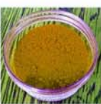
OSSIDO DI FERRO OCRA 90/G