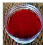
OSSIDO DI FERRO ROSSO 90/R