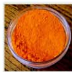
GIALLO ARANCIO 83/O