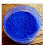
BLU OLTREMARE 40/BO