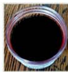
OSSIDO DI FERRO NERO 90/N