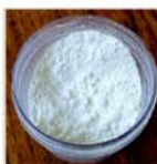
BIOSSIDO DI TITANIO 30/TIT