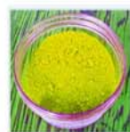
GIALLO VIVO 74/O